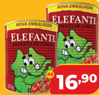
EXTRATO DE TOMATE ELEFANTE LT 850G