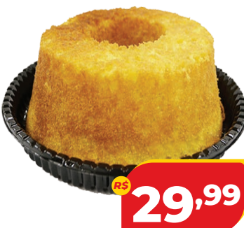
BOLO SUÍÇO DACASA KG SABORES