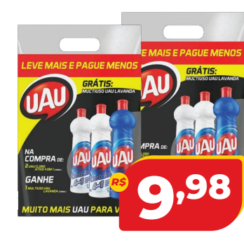
KIT UAU MULTIUSO + CLORO ATIV 500ML