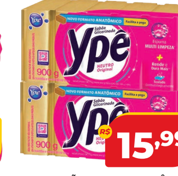
SABÃO EM BARRA YPÊ NEUTRO 900G