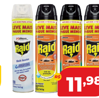
INSET AERO RAID 420ML LV+PG- MULTI