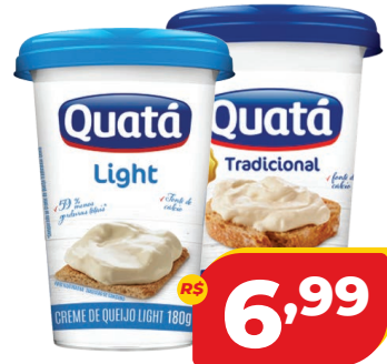
CREME DE QUEIJO QUATÁ 180G TRAD./ LIGHT