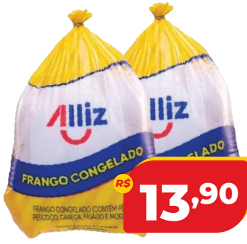
FRANGO ALLIZ CONG. KG