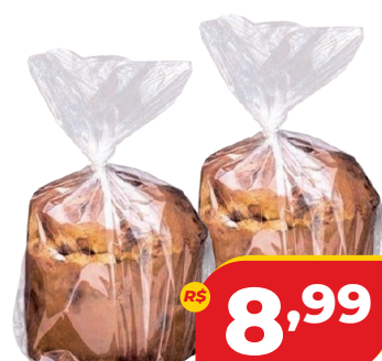
PANETTONE DACASA SACO 500G