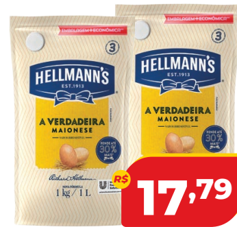
MAIONESE HELLMANN'S TRAD. SC 1KG