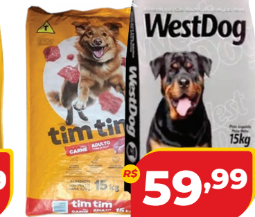
RAÇÃO TIM TIM OU WESTDOG 15KG