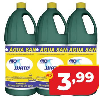
ÁGUA SANITÁRIA PROWATER 2L