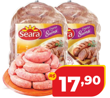
LINGUIÇA SUÍNA SEARA KG