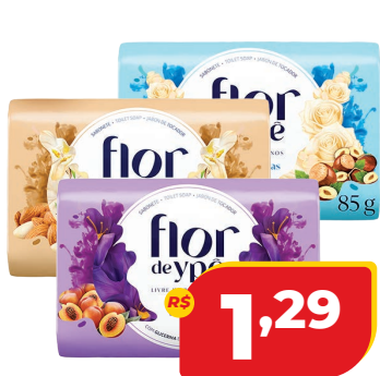
SABONETE FLOR DE YPE 85G