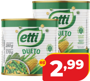
MILHO VERDE ETTI LT 170G