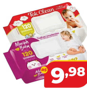
TOALHA UMEDECIDA C/120 TOK CLEAN OU MARIAH