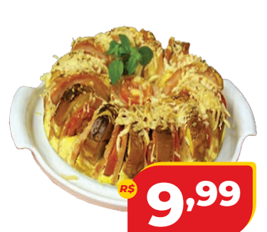
ROSCA SALGADA DACASA 250G