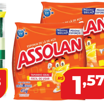
LÃ DE AÇO ASSOLAN 45G C/8