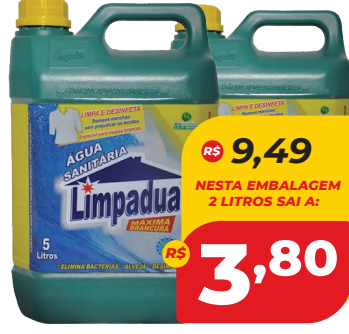
ÁGUA SANITÁRIA LIMPÁDUA 5L

R$ 9,49 NESTA EMBALAGEM 2 LITROS SAI A: 3,80