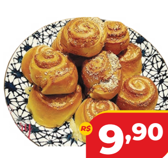
ROSCA DE COCO DACASA 300G