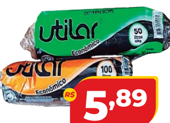
SACO LIXO UTILAR 50L C/10 OU 100L C/5