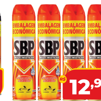
INSET. AERO SBP 380ML