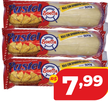
MASSA DE PASTEL SOELLA ROLO 500G