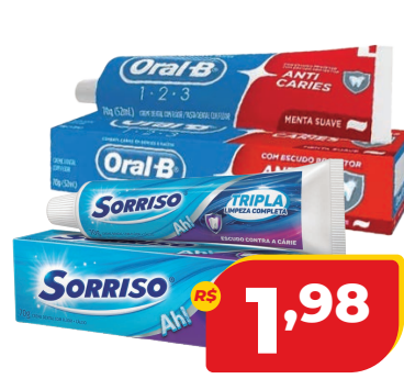
CD ORAL B 123 MENTA / SORRISO TRIPLA LIMPEZA COMP 70G

R$ 23,34 NESTA EMBALAGEM A UNIDADE SAI A 3,89