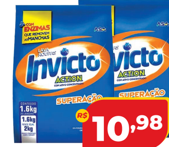
SABÃO EM PÓ INVICTO SC 1,6KG