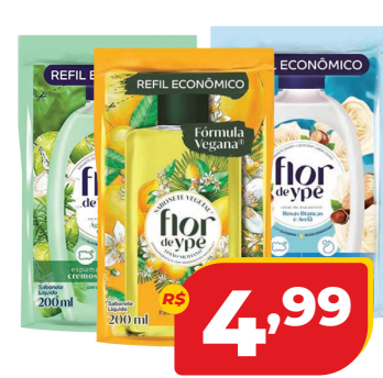
SB FLOR DE YPÊ LIQ SC 200ML