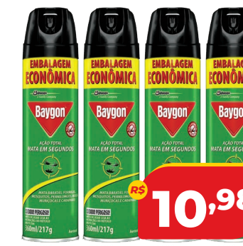
INSET. AERO BAYGON 360ML