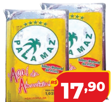
POLPA PALAMAZ AÇAÍ 1,02KG