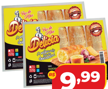
PÃO ALHO DELÍCIA TRAD 350G