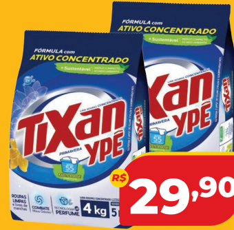
SABÃO EM PÓ TIXAN YPÊ SC 4KG