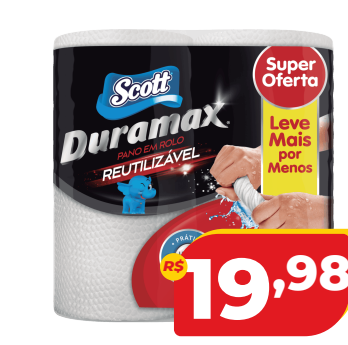
PANO SCOTT DURAMAX ROLO REUTI C/116 BRANCO