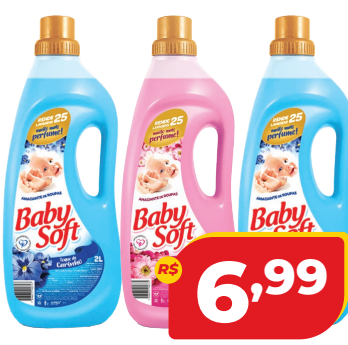
AMACIANTE BABY SOFT 2L