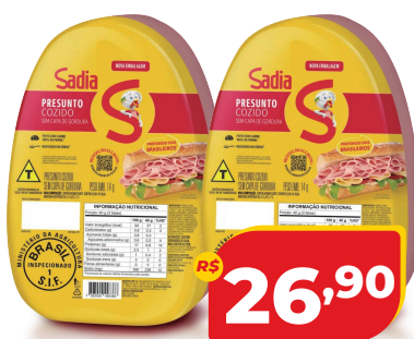
PRESUNTO SADIÁ COZIDO PC KG