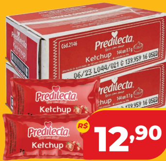
KETCHUP PREDILECTA SC 144X7G