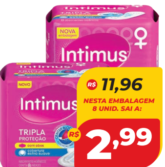
ABSORVENTE INTIMUS GEL NORMAL C/32 UND.