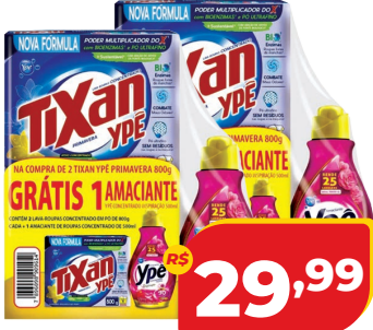
KIT 2 SABÃO PO TIXAN YPE PRIMA 800G + 1 AMAC 500ML