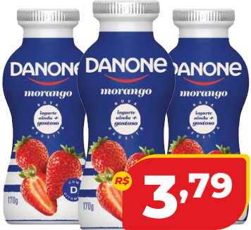
IOG. DANONE LIQ. 170G MORANGO