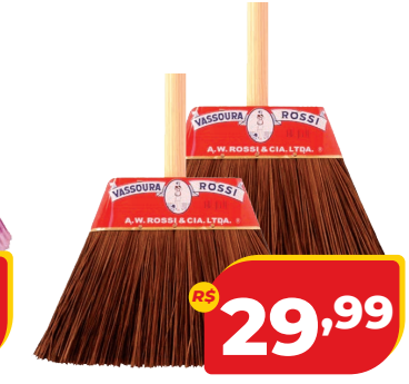
VASSOURA ROSSI PIAÇAVA