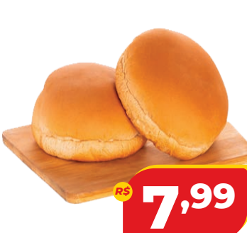
PÃO DE HAMBURGUER DACASA 350G