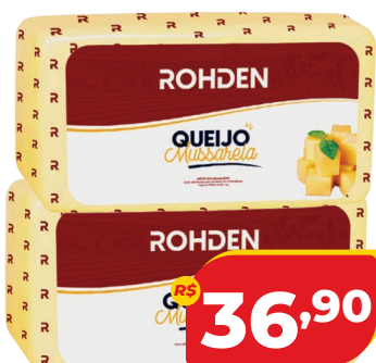
QUEIJO MUSSARELA ROHDEN PEÇA KG