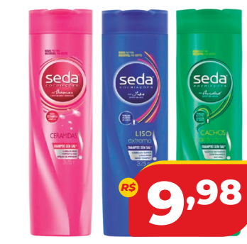
SH SEDA 325ML EXCETO ANTICASPAS