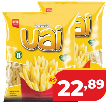
BATATA UAI PALITO CONG. PCT 2KG