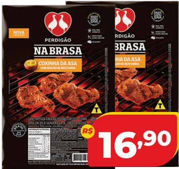
COXINHA DA ASA PERDIGÃO NA BRASA PCT 800G M. MOSTARDA