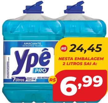
AMACIANTE YPÊ PRO 7L ROUPAS TECIDOS

R$ 24,45 NESTA EMBALAGEM 2 LITROS SAI A: 6,99