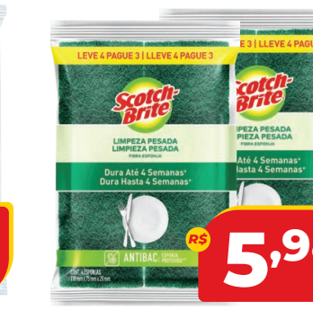
ESPONJA SCOTCH BRITE LIMPEZA PESADA LV 4 E PG 3