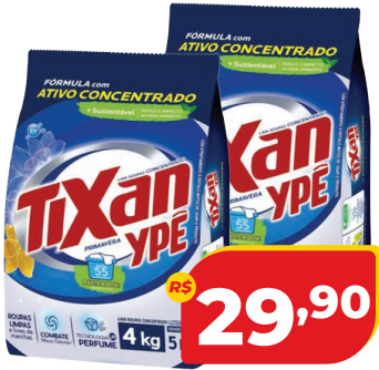
SABÃO EM PÓ TIXAN YPÊ SC 4KG