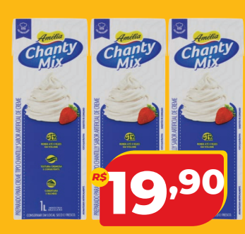
CHANTY MIX AMELIA TP 1L