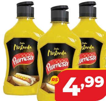
MOSTARDA PRAMESA TRAD. SQZ 300G