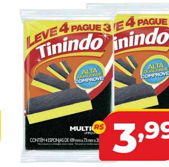
ESPONJA TININDO MULTIUSO LEVE 4 E PAGUE 3