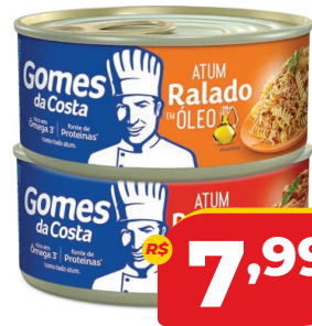
ATUM G DA COSTA RALADO 170G SABORES