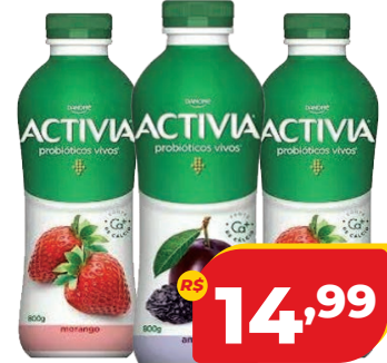
LEITE FERMENTADO ACTIVIA TRAD. 800G