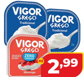
IOG. VIGOR GREGO 90G SABORES