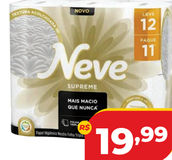
PAPEL HIG. NEVE SUPREME FT LV 12 E PG 11 20M