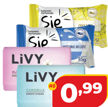
SABONETE 85G SIENE OU LIVY

OFERTAS VÁLIDAS DE 28 A 31 DE MARÇO DE 2025 OU ENQUANTO DURAREM OS ESTOQUES.