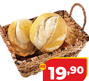
PÃO CERVEJINHA DACASA KG