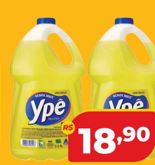
DETERGENTE YPÊ 5 L