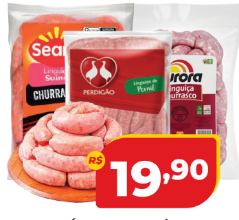
LINGUIÇA SUÍNA AURORA/ SEARA OU DE PERNIL PERDIGÃO KG