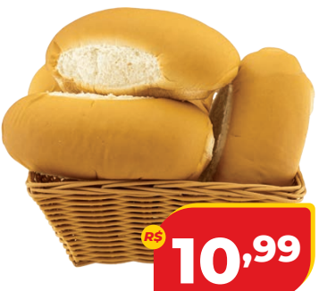
PÃO DACASA HOT DOG M 500G