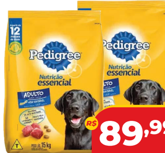
RAÇÃO PEDIGREE NUTRI ESSENCIAL 15KG