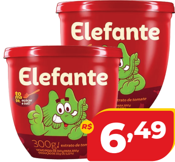
EXTRATO DE TOMATE ELEFANTE PT 300G