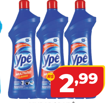
LIMPADOR YPÊ MULTIUSO 500ML