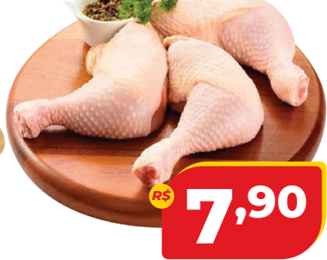
COXA COM S/COXA DE FRANGO CONG. KG