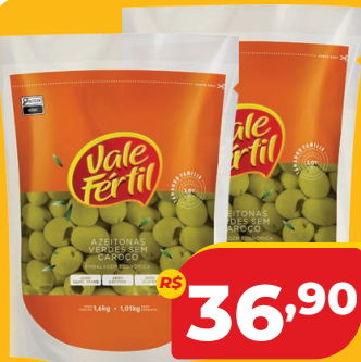
AZEITONA VERDE VALE FÉRTIL S/CAROÇO 1,01KG SC