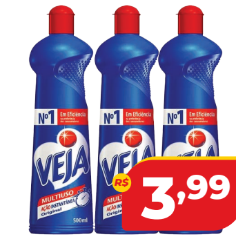
LIMPADOR VEJA MULTIUSO ORIGINAL 500ML