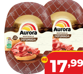
MORTADELA AURORA DEFUMADA PC KG