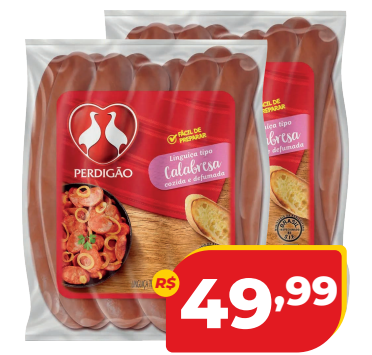
LINGUIÇA CALAB PERDIGÃO PCT 2,5KG