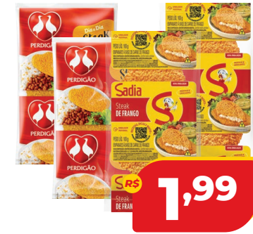
STEAK DE FRANGO 100G SADIÁ OU PERDIGÃO