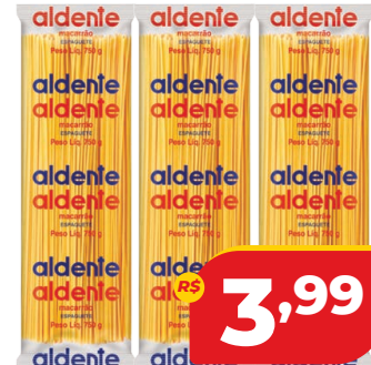
MAC. PIRAQUÊ ALDENTE ESPAGUETE 750G