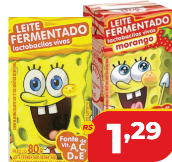
LEITE FERM. BOB SPONJA UND. 80G TRAD./ MOR.