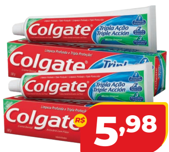
CREME DENTAL COLGATE TRIPLA AÇÃO 180G