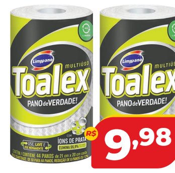
PANO LIMPANNO TOALEX C/44 UND.