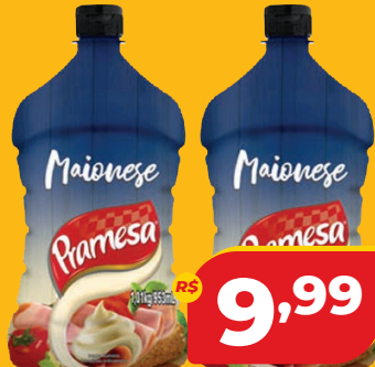
MAIONESE PRAMESA PT 1,01KG