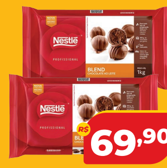
COBERTURA NESTLÉ BLEND 1KG