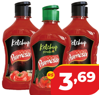
CATCHUP PRAMESA BISN. 300G PICANTE/ TRAD.