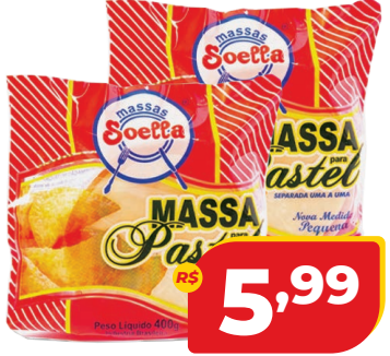
MASSA DE PASTEL SOELLA 400G