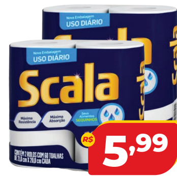
PAPEL TOALHA SCALA C/2 60FLS