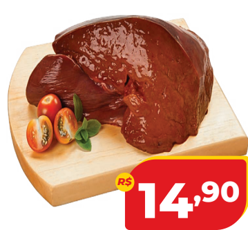
FÍGADO BOVINO KG