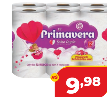
PAPEL PAPEL HIG. PRIMAVERA FIT FD C/12 20M