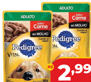
ALIM PEDIGREE AD SC 100G