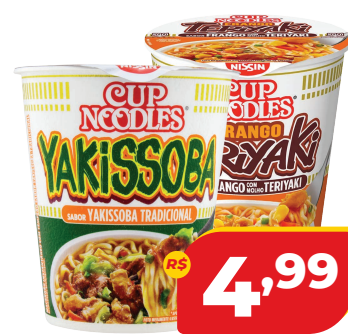
MAC. INST. NISSIN CUP NOODLES SABORES