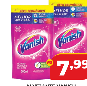
ALVEJANTE VANISH LIQ. REFIL 500ML