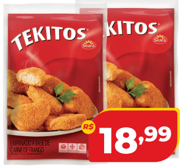
TEKITOS SEARA 1KG