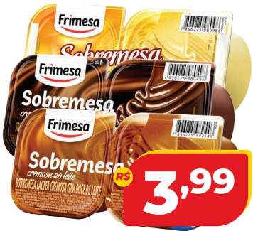
SOBREMESA LACTEA FRIMESA 200G SABORES