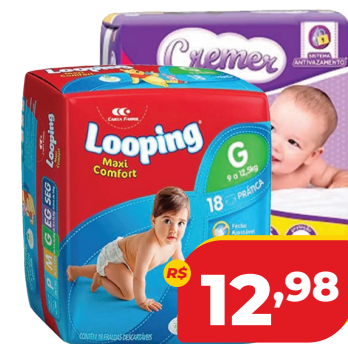
FRALDA DESC. CREMER DISNEY OU LOOPING L. TUNES JUMB.