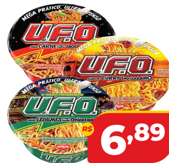
MAC. INST. NISSIN YAKISSOBA UFO