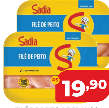
FILÉ DE PEITO DE FRANGO SADIÁ BIFES BDJ 800G