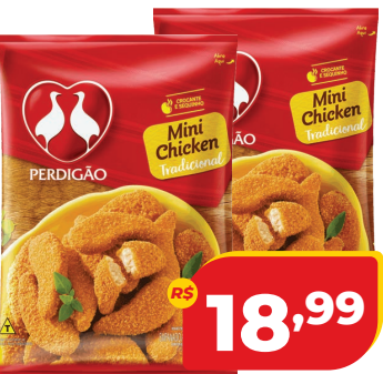
MINI CHICKEN EMPANADO PERDIGÃO 1KG