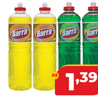
DETERGENTE BARRA 500ML