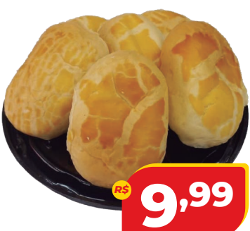
BISNAGUINHA CEARENSE DACASA 300G