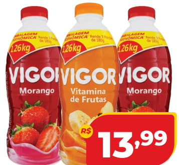
IOG. VIGOR 1260G SABORES