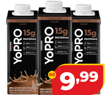
BEBIDA LACTEA YOPRO 15G PROT. CHOC. 250ML