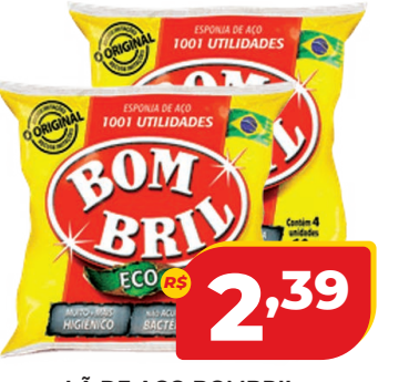
LÃ DE AÇO BOMBRIL 60G C/4