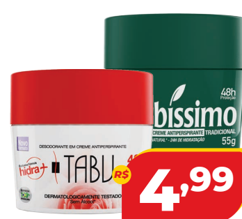
DESODORANTE HERBISIMO CREME 55G OU TABU CREME 55G AERO