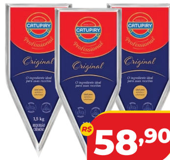
REQUEIJÃO CATUPIRY CREMOSO BISN. 1,5KG