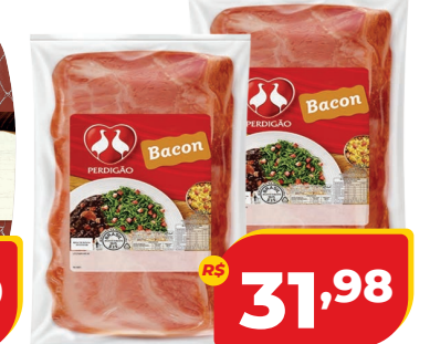
BACON PERDIGÃO PEÇA KG