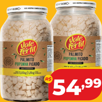
PALMITO PUPUNHA VALE FÉRTIL PICADO 1,8KG