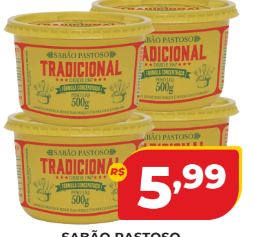
SABÃO PASTOSO TRADICIONAL 500G