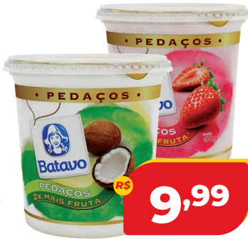
IOG. BATAVO INTEGRAL C/PEDAÇOS 450G SABORES