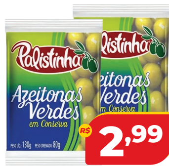
AZEITONA VERDE PALISTINHA SC 80G