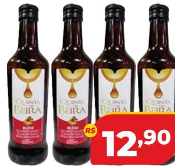
ÓLEO COMPOSTO QUINTA DA BEIRA BLEND E TEMP 500ML