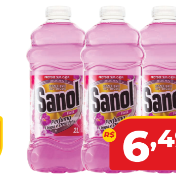
DESINFETANTE SANOL 2L