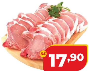
CARRÉ SUINO KG