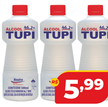
ALCOOL TUPI 46,2 INPM LIQ 1L