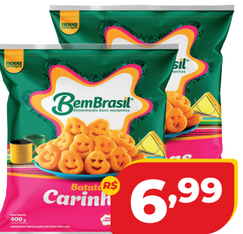
BATATA BEM BRASIL CONG. 400G CARINHAS