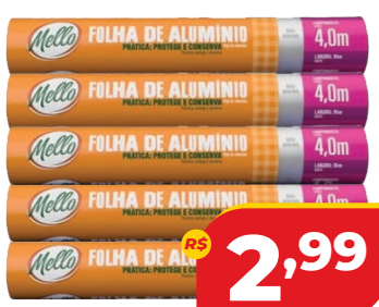
PAPEL ALUMINIO MELLO 0,30CMx4M