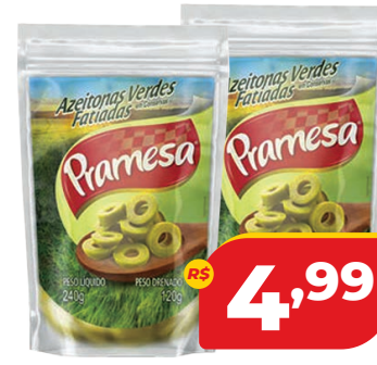
AZEITONA VERDE PRAMESA FAT. SC 120G