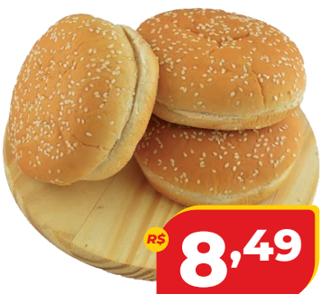
PÃO DACASA HAMBURGUER C/GERGILIM 380G