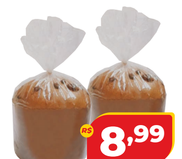
CHOCOTTONE DACASA SACO 500G