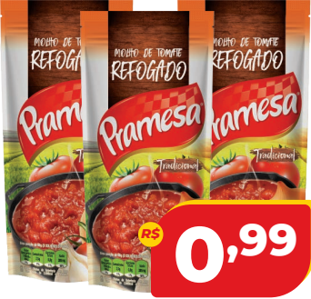
MOLHO DE TOMATE PRAMESA REFOGADO SC 300G