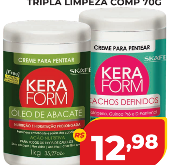
CREME KERAFORM 1KG PENTEAR OU TRATAMENTO