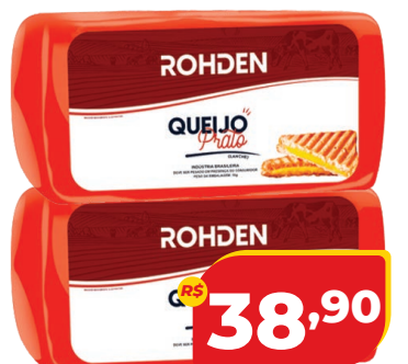
QUEIJO PRATO ROHDEN PEÇA KG