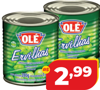
ERVILHA OLE LT 170G