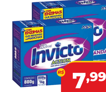
SABÃO EM PÓ INVICTO CX 800G