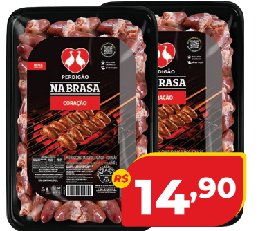
CORAÇÃO DE FRANGO PERDIGÃO NA BRASA PCT 500G