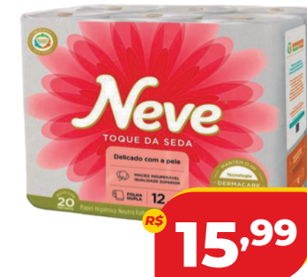
PAPEL HIG. NEVE TOQUE DE SEDA C/12 20M