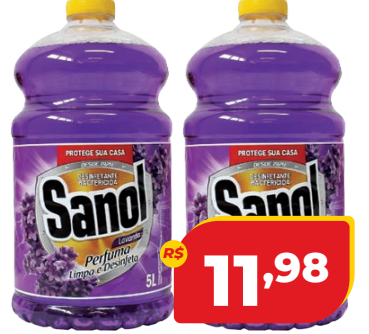
DESINFETANTE SANOL 5L

R$ 9,49 NESTA EMBALAGEM 2 LITROS SAI A: 3,80