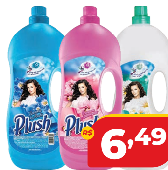
AMACIANTE PLUSH 2L