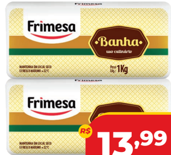
BANHA FRIMESA 1KG