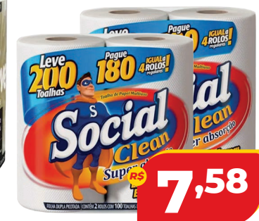
PAPEL TOALHA SOCIAL CLEAN L200 P180F