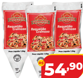
REQUEIJÃO PURANATA CREMOSO BISN. 1,5KG