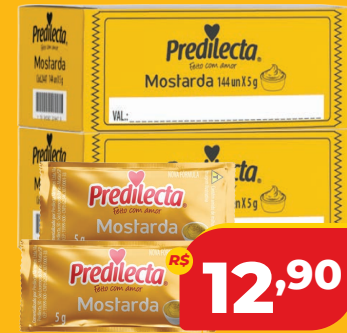
MOSTARDA PREDILECTA SC 144X5G