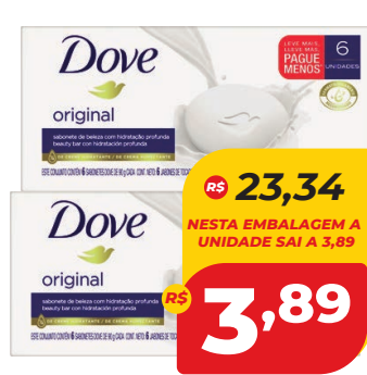
SABONETE DOVE C/6 90G

R$ 23,34 NESTA EMBALAGEM A UNIDADE SAI A 3,89