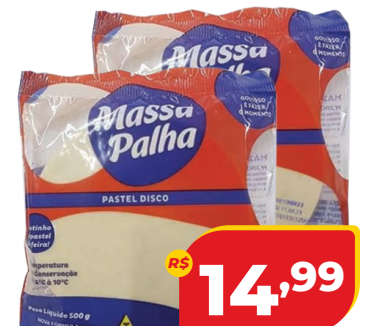
MASSA DE PASTEL PALHA QUADRADO 1KG