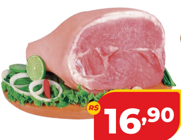
PERNIL C/ OSSO KG