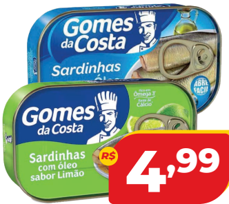
SARDINHA G DA COSTA RALADA 00G SABORES