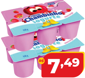
IOG. EM POLPA CHAMBINHO MORANGO 510G