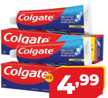
CREME DENTAL COLGATE MPA 120G