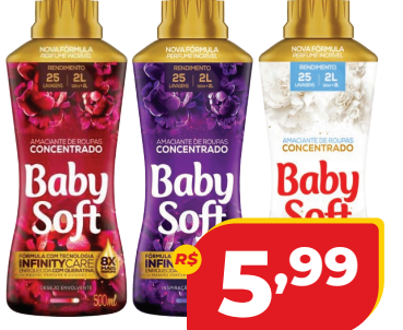
AMACIANTE BABY SOFT CONC. 500ML

R$ 14,97 NESTA EMBALAGEM 500ML SAI A: 9,98