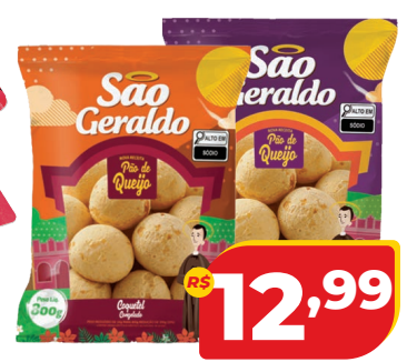
PÃO DE QUEIJO SÃO GERALDO 800G TRAD/COQUET