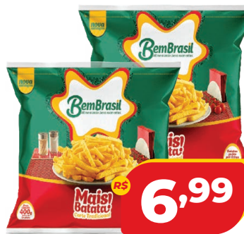
BATATA BEM BRASIL MAIS BATATA CONG. 400G