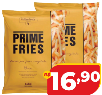
BATATA PRIME FRIES CONG 10MM 1,5KG