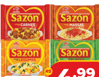
TEMPERO SAZON 60G SABORES