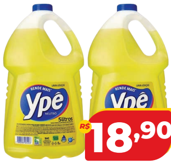
DETERGENTE YPÊ 5L

R$ 24,45 NESTA EMBALAGEM 2 LITROS SAI A: 6,99