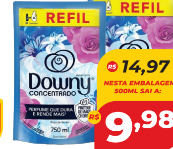
AMACIANTE DOWNY CONC. SC 750ML

R$ 14,97 NESTA EMBALAGEM 500ML SAI A: 9,98