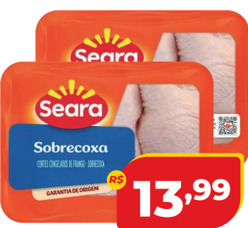
HAMBÚRGUER MISTO AURORA FAROESTE 56G