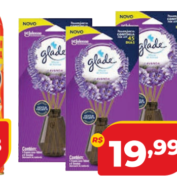
DIFUSOR GLADE AMBIENTES 100ML