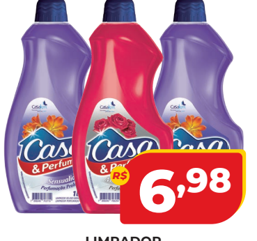
LIMPADOR CASA&PERFUME 1L