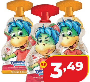
IOG. DANONINHO PRA LEVAR 70G