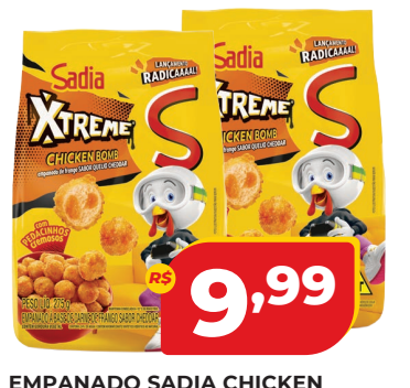
EMPANADO SADIÁ CHICKEN BOMB 275G QUEIJO CHEDDAR