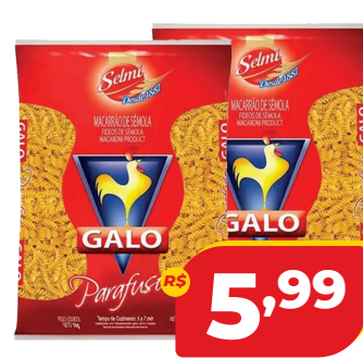
MAC. GALO SEMOLA PARAFUSO 1KG