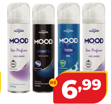
DESODORANTE AERO MOOD 150ML