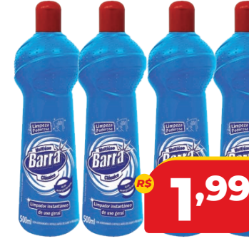
LIMPADOR BARRA MULTIUSO 500ML