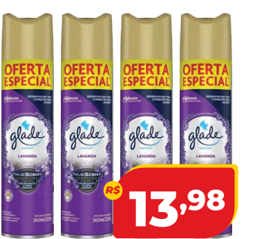
GLADE AERO 360ML