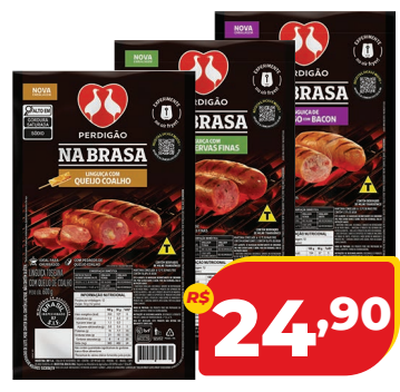
LINGUIÇA PERDIGÃO NA BRASA PCT 600G