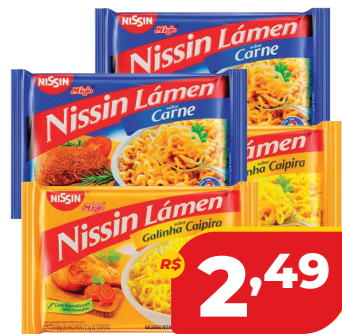
MAC. INST. NISSIN LAMEN 85G CARNE/ GALINHA CAIPIRA