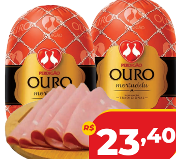
MORTADELA PERDIGÃO OURO DEFUMADA PEÇA KG