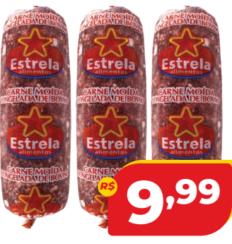
CARNE MOÍDA ESTRELA CONG. PCT 500G