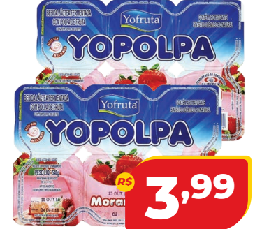
BEB. LACTEA YOPOLPA MORANGO 540G