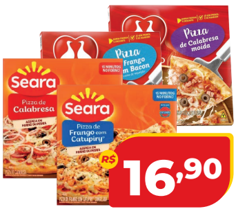
PIZZA 460G SEARA OU PERDIGÃO