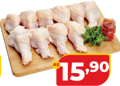
COXINHA DA ASA DE FRANGO KG