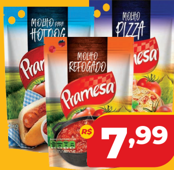
MOLHO DE TOMATE PRAMESA SC 2KG REFOG./ PIZZA/ HOT DOG