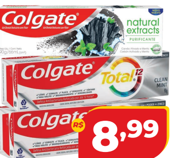
CREME DENTAL COLGATE 90G TOTAL 12 OU NATURAL EXTRACTS CARVÃO ATIVADO E MENTA