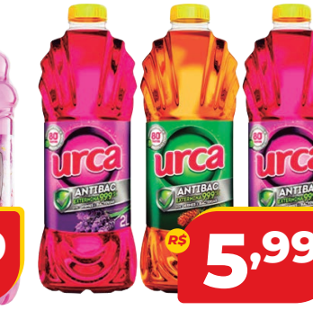
DESINFETANTE URCA 2L