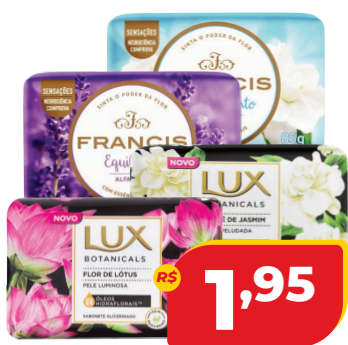
SABONETE SUAVE 85G FRANCIS OU LUX BOTANICALS