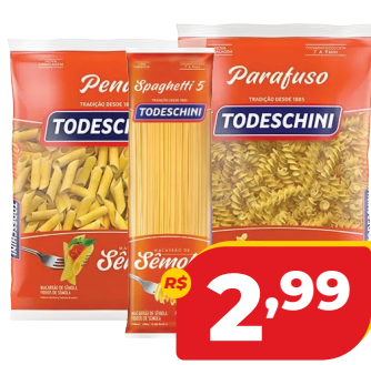
MAC. TODESCHINI SEMOLA 500G PARAFUSO/PENA.ESP