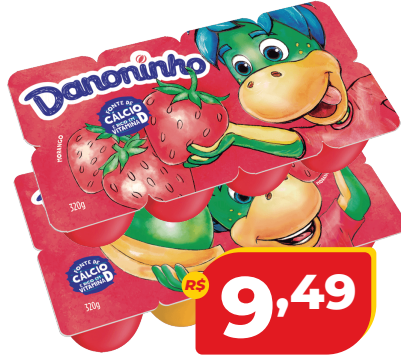
PETIT SUISE DANONINHO 320G MOR/ MULTI