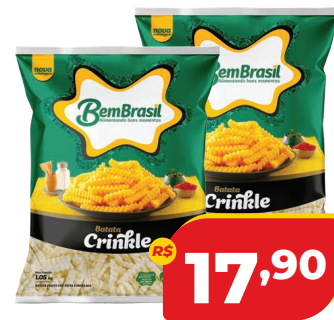
BATATA BEM BRASIL CRINKLE 1,05KG