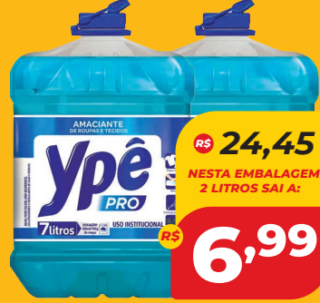
AMACIANTE YPÊ PRO 7L ROUPAS TECIDOS