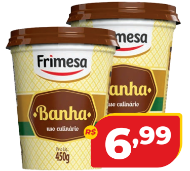
BANHA FRIMESA POTE 450G