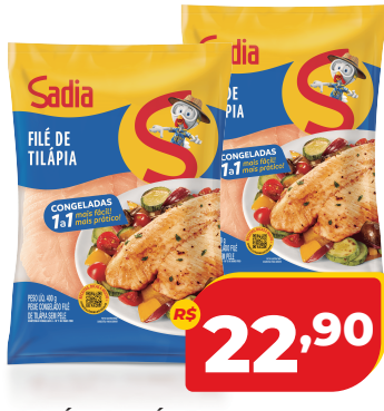
FILÉ DE TILÁPIA SADIÁ CONG PACOTE 400G