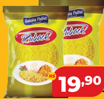
BATATA PALHA RUBACK 900G