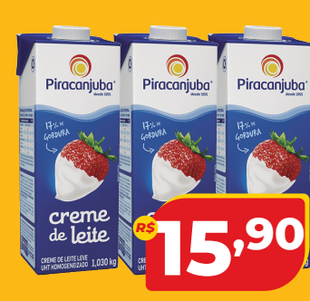
CREME DE LEITE PIRACANJUBA LEVE 1,030KG