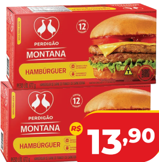
HAMBÚRGUER PERDIGÃO 672G