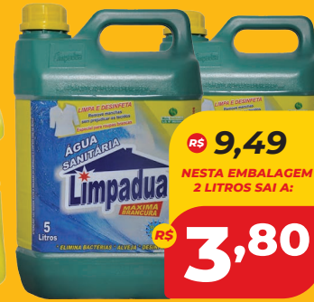
ÁGUA SANITÁRIA LIMPADUA 5L