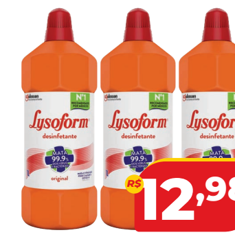
DESINFETANTE LYSOFORM 1L