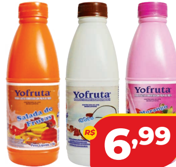
BEB. LACTEA YOFRUTA FERMENTADA 1L