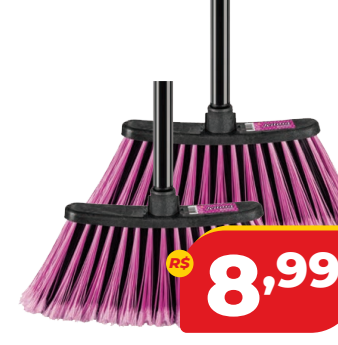
VASSOURA BETTANIN JEITOSA