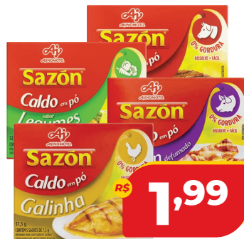
CALDO EM PÓ SAZON 32,5G SABORES