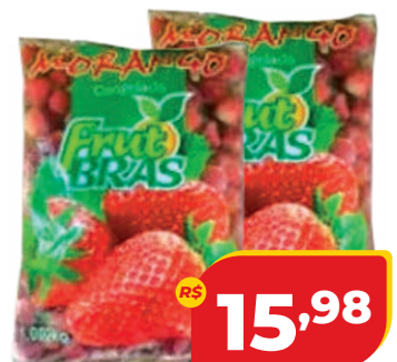
MORANGO FRUTBRAS CONG. 1,002KG