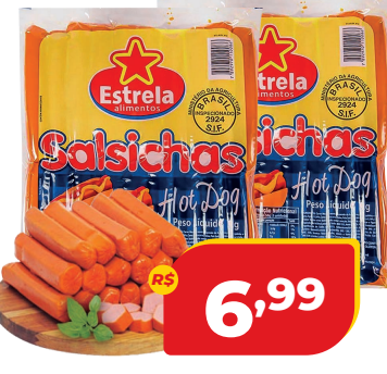
SALSICHA ESTRELA HOT DOG KG