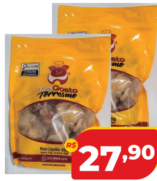
TORRESMO TIRA GOSTO NA BANHA PCT 650G